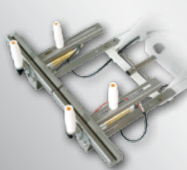
Pinza doppia Double clamps Doppelbeinklemmen Pinces doubles