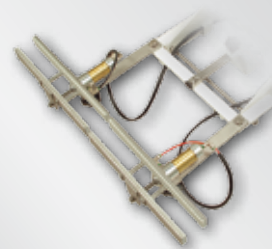
Pinza standard Standard clamps Standard-Beinklemmen Pinces standard

On TP65 only: pocket clamps; mechanical size adjustment stop.